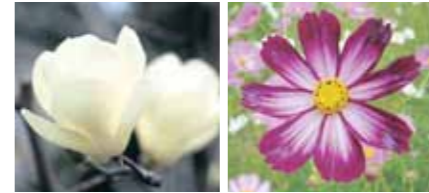
モクレン コスモス

また、この博覧会開催にあわせて、平成2年3月に地下鉄鶴見緑地線が京橋~鶴見緑地間で開通。区役所の近くにも蒲生四丁目駅ができました。