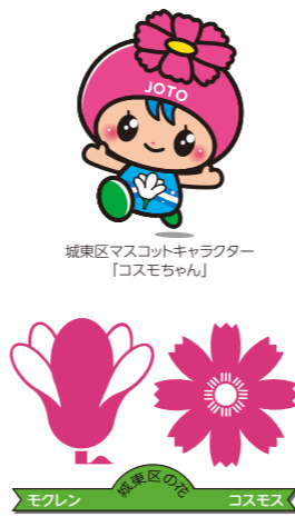
モクレン 城東区の花 コスモス