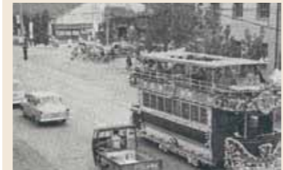
蒲生四丁目前を走る市電の花電車。お祝いごとがあると花電車が走っていたようです