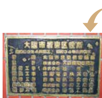
現城東区役所の建設名盤