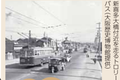
新喜多大橋付近を走るトロリーバス