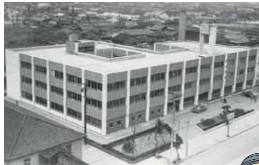
完成当時の現城東区役所