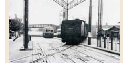
少しさかのぼりますが、昭和31年頃に現在の蒲生一丁目付近を撮影したもので、蒸気機関車が踏切を通過するのを、今福行き市電が向こうで待っている様子が写っています

貨物線。昭和57年に廃止(の部分)されました。廃線後は公園や遊歩道となり、当時の名残を現在もとどめています。