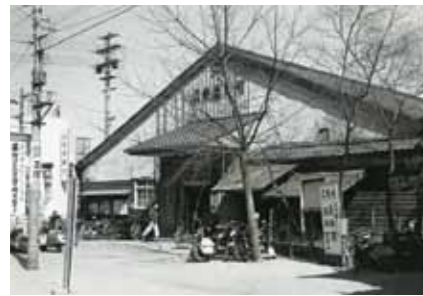
旧城東区役所(昭和30年頃)

その1 最初の城東区役所は昭和18年、区の誕生とともに蒲生四丁目交差点南東の角に木造2階建ての庁舎を新築したものでした。しかし、昭和20年に空襲で焼失したため、一時は今福小学校の一部を仮庁舎としていましたが、まもなく元の位置に木造平屋建ての庁舎が建てられました。