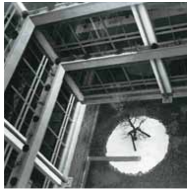
建設当時は中庭がありました。その後待合ロビーへと変わりました。

その2 戦後、区役所の事務が著しく増加し、あわせて区民の方々の要望もあり、昭和33年4月21日に現在の場所に庁舎の建設が着手されました。そして昭和34年2月10日に現在の城東区役所が完成し、3月から業務を開始しました。