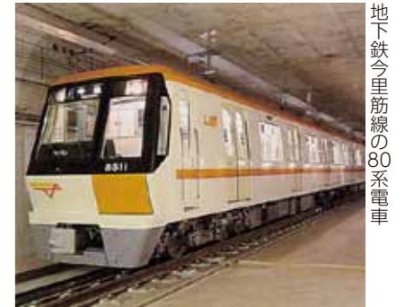
地下鉄今里筋線の80系電車

その6 平成18年12月には、城東区の中央部を南北に貫く地下鉄今里筋線が開通。区役所のすぐ前にも地下鉄への入り口ができました。