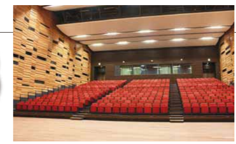
E 区民センター(ホール 観客席)