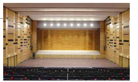
E 区民センター(ホール 舞台)