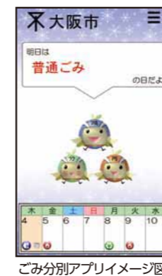
ごみ分別アプリイメージ図