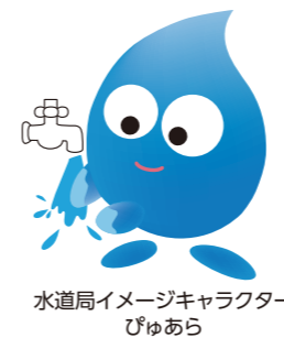
水道局イメージキャラクター ぴゅあ

水道に関する各種お届けや、お問い合わせを受け付けており、引っ越しなどで手続きの多くなる3月・4月は、日曜・祝日も営業します。