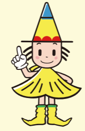
選挙マスコット「センキョン」

将来を担う若い世代の声をこれまで以上に政治に取り入れることができるよう、6/20以降に公示される国政選挙から、選挙権年齢が「満18歳以上」に引き下げられます。これにより、市内でも約4万人の方が新たに投票できるようになります。詳しい内容はHPをご覧ください。問行政委員会事務局選挙課 ☎6208-8511 FAX6204-0900