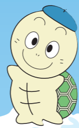
大阪市生涯学習ルーム マスコットキャラクター 「スタートル」

生涯学習ルームとは、小学校の特別教室等を活用して、講習や講座を実施している活動です。区内では、次のとおり各小学校で生涯学習ルームを実施しています。講座によっては、受講者を校区内居住者に限っているものがあります。