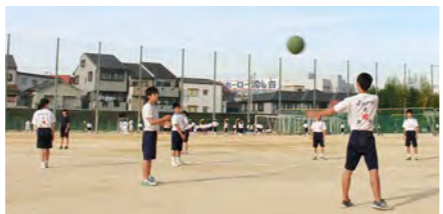
▲重さ5kgのボールを投げて体幹を鍛えます