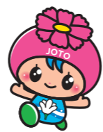
城東区マスコットキャラクター コスモちゃん