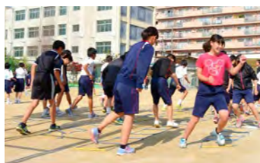
▲マス目状のラダーを使い小刻みに進む練習をします