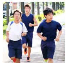
▲長距離選手は市営住宅の外周を走ります