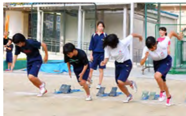
▲スタートダッシュの練習をメインに行っています