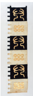
鹿角六連銭紋旗指物 江戸時代個人蔵

戦国武将として絶大な人気を誇る真田信繁(幸村)の自筆書状や武器・武具、「真田丸」図などの歴史資料を紹介いたします。費用1300円ほか。日9/17(土)～11/6(日)9:30～17:00(入館は16:30まで)※期間中の金曜日は20:00まで(入館は19:30まで)火曜休館 場 大阪歴史博物館 6946-5728 6946-2662