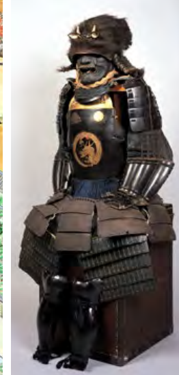
▲日月電文蒔絵 仏胴具足(大阪城天守閣蔵) 胴に太陽と月が金銀の蒔絵で描かれた具足。後藤又兵衛の遺品といわれています