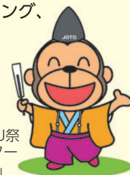
城東区SARUGAKU祭 イメージキャラクター 「ゆめのや猿之介」