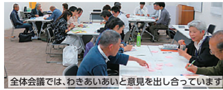
全体会議では、わきあいあいと意見を出し合っています

問合せ 区役所市民協働課(市民活動支援担当) (〒536-8510 中央3-5-45) ☎ 6930-9041 ☎ 6931-9999 ✉ tq0002@city.osaka.lg.jp