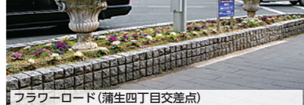
フラワーロード(蒲生四丁目交差点)