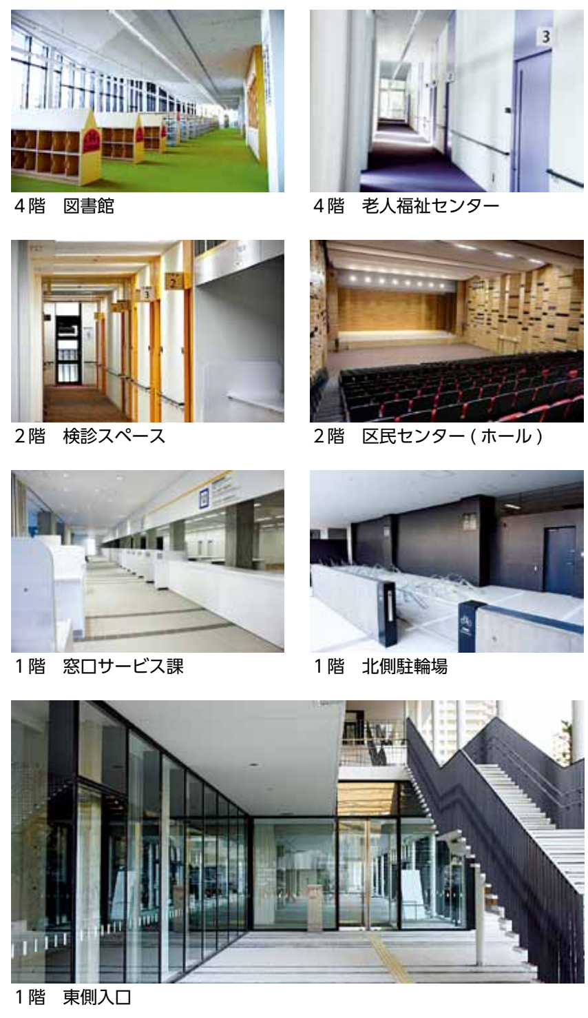
4階 図書館 4階 老人福祉センター 2階 検診スペース 2階 区民センター（ホール） 1階 窓口サービス課 1階 北側駐輪場 1階 東側入口