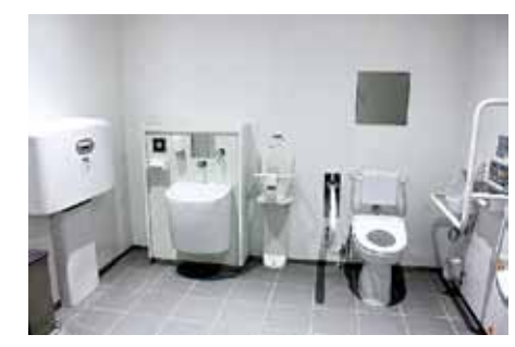
多目的トイレ すべての階に、おむつを替える台の付いた多目的トイレがあります。