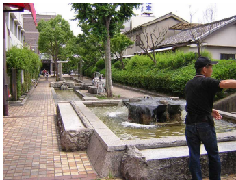
トモノス城東前の楠根川跡緑陰歩道