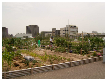
放出下水処理場上部の市民農園と緑地・憩いのスペース