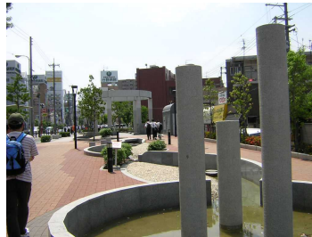
JR淀川連絡線跡遊歩道