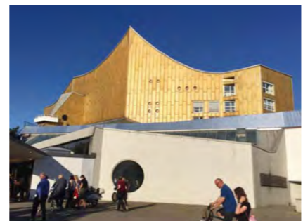
▲ベルリン・フィルハーモニー管弦楽団の本拠。定期演奏会をよく聴きに行きます

ベルリンには、「ベルリン・フィルハーモニー管弦楽団」のような名門オーケストラから、アマチュア楽団による教会でのコンサート、路上のバイオリン弾きまで、その人