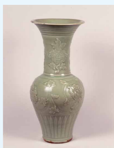
青磁貼花牡丹唐草文瓶 龍泉窯 元時代(14世紀) 太山寺(兵庫)

①世界中で珍重されている淡い青緑色の釉薬を用いた龍泉窯をはじめ、高雅な中国青磁や透明感あふれる高麗青磁などを展示。夏の日、目に涼やかな工芸品の数々をお楽しみください。②丸山石根(1919～1999)は大阪で生まれ、日展などで活躍した日本画家。8年の歳月をかけ完成された西国三十三所霊場の観音画像を紹介。慈愛に満ちた御仏の姿を心やすら