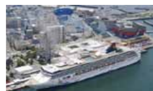
スーパースター・ヴァーゴ

アジアを代表するスター・クルーズ社の「スーパースター・ヴァーゴ」(①)と、「洋上の美術館」とも称される「アムステルダム」(②③)の船内を特別にご覧いただける見学会。定員各48人。 回 ①10/14(土)14:30~16:00 ②10/18(水)9:30~11:00 ③10/18(水)11:30~13:00 場 集合: