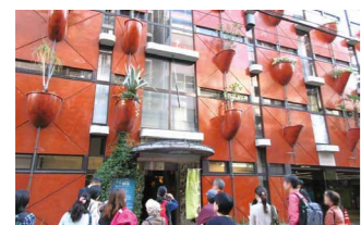
オーガニックビル(中央区南船場)

“生きた建築”とは、歴史と文化、そして市民の暮らしを支えつつ、時代に合わせ様々な形で変化・発展しながら、いきいきとその魅力を物語る建築物等のこと。イケフェス大阪は、それらの一斉特別公開イベント。充実のプログラムに加え、今年は、“生きた建築”が生まれる現場も特別公開!