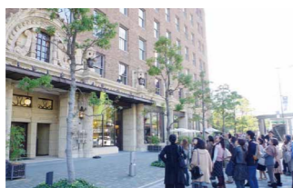
ダイビル本館(北区中之島) ※いずれも昨年の様子

日程 10月28日(土)、29日(日) 開催日前後の期間にも多数のプログラムを実施 会場 大阪市内各所(御堂筋およびその周辺ほか) 主催 生きた建築ミュージアム大阪実行委員会 詳細は実行委員会HPをご覧ください。