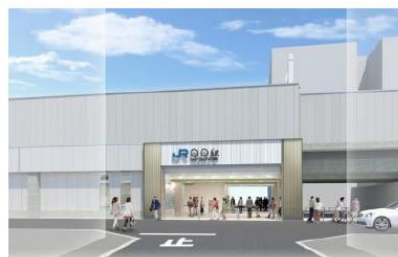
おおさか東線 新駅イメージパース

鉄道交通網では地下鉄谷町線・長堀鶴見緑地線・今里筋線・中央線、JR 学研都市線、京阪電鉄の各鉄道が区内を走っています。また、現在すすめられている、おおさか東線の整備（平成 30 年度末開業予定）など、公共交通機関の充実により利便性の一層の向上が見込まれています。