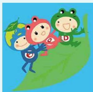
大阪市下水道公式キャラクター

放出下水処理場のシンボルフラワー「ヒラドツツジ」が咲く頃にあわせて、下水処理場を公開します。普段見ることのできない下水処理場を見学し、汚れた水をきれいにするしくみや浸水からまちを守るポンプの役割を学ぶことが出来ます。ぜひお越しください。