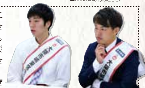
城東区住みます芸人「アンリミテッド」(レージョン)

ぼくたちの幼少期に阪神淡路大震災が起きました。兵庫県に住んでいたため被害は大きく、1年以上仮設住宅で過ごしていたそうです。幸い、家族は無事でしたが、幼いころから震災に備えることの大切さや、訓練などを行ってきました。城東区の皆さんも、大切な命を守るため、ぜひこのノートを活用してください。