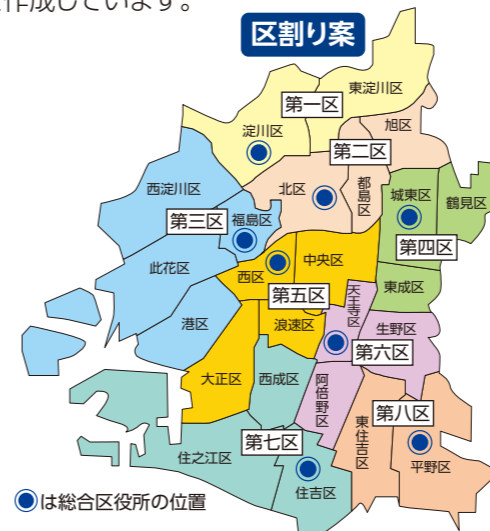
●は総合区役所の位置