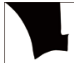
エリック・ゼッタクワイスト 《青磁劃花 葉文 八角水注》2016年

ニューヨークを拠点とする写真家エリック・ゼッタクワイストの日本初個展として、当館の所蔵品を撮影した34点の写真を、被写体となった陶磁器作品とともにご紹介。