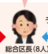
総合区長(8人) ※住民から市長への意見・提案もできます。