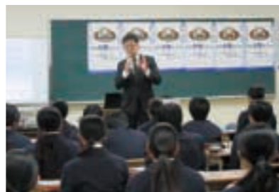
市立南港南中学校での開催風景▲

実施期間 / 2018年12月～2019年3月 対象 / 住之江区内の小学校・中学校(14校を予定) ※小学校は高学年以上 講師 / 外務省職員、大阪市職員