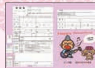
◆作者:吉田 晴亮さん