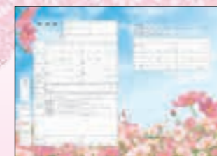
◆作者:大野 麻子さん