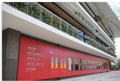
城東区複合施設 外観

現在の当区は、区内北東部の関目・董地区が戦前に行われた土地区画整理事業により緑の多い整然とした街区となり、また西南部の森之宮地区では、かつての陸軍砲兵工廠跡地には JR・地下鉄の車庫や高層住宅団地が、さらに鳴野地区も再開発により新たな高層住宅群が出現するなど、街並みは大きな変貌をとげてきました。そして近年では区内各地区で工場等の転出跡地などに高層集合住宅や大規模小売店が相次いで建設されるなど、生活・交通至便な住宅地へと変化しています。