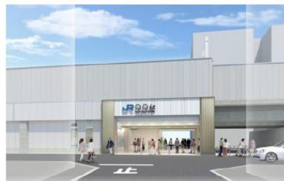
おおさか東線 新駅イメージパース

鉄道交通網では地下鉄谷町線・長堀鶴見緑地線・今里筋線・中央線、JR 学研都市線、京阪電鉄の各鉄道が区内を走っています。また、現在すすめられている、おおさか東線の整備（平成 30 年度末開業予定）など、公共交通機関の充実により利便性の一層の向上が見込まれています。