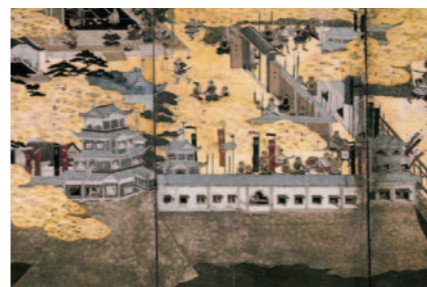
戦国合戦図屏風(左隻4・5・6扇)〈個人蔵〉

天守閣のコレクションの中から武家文化に関する資料を厳選して公開。合戦図屏風や武器・武具など、サムライたちの躍動感あふれる展示をご覧ください。