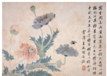
《罌粟図》王武 清時代・康熙15年(1676) 本館蔵

中国・明~清時代の院体画・文人画に描き出された、花や鳥の華麗な競艶が楽しめます。 日 5/12(日)まで 9:30~17:00(入館は16:30まで、会期中の休館日なし) 場 市立美術館 ¥ 大人300円ほか 問 市立美術館 ☎6771-4874 FAX6771-4856