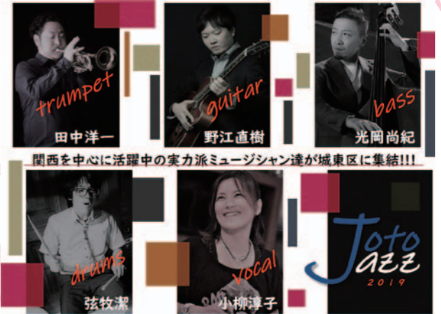
関西を中心に活躍中の実力派ミュージシャン達が城東区に集結!!!