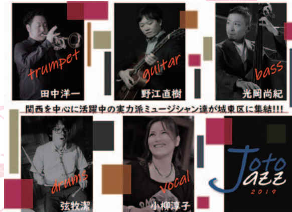
関西を中心に活躍中の実力派ミュージシャン達が城東区に集結!!!