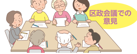
区政会議での意見