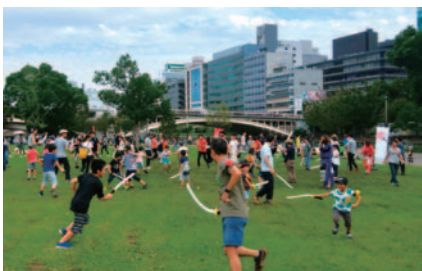
昨年の体験型アクティビティの様子

水辺の芝生で楽しく過ごす「クラフトピアピクニック」や体験型アクティビティといった親子で楽しめる外遊びなど、中之島公園を中心に水辺に親しむプログラムを多数展開。詳しくはHPをご覧ください。 日 11/10(日)まで 問 経済戦略局観光課 電 6210-9311 FAX 6615-6300