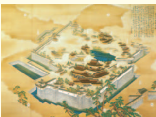
聚楽第図(大阪城天守閣蔵)

収蔵品の中から、秀吉が築いた大坂城・聚楽第・伏見城をはじめ、各地の城郭を描いた屏風絵・額絵・錦絵・縄張図などを展示。 日 10/10(木)まで 9:00～17:00(入館は16:30まで)