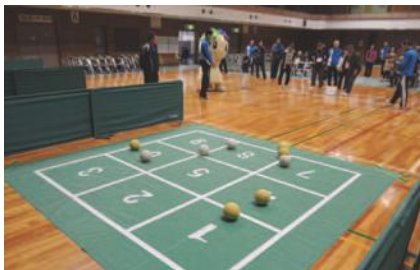
スリーアイズの様子

トップアスリートから指導を受けられるサッカーやバレーボール等をはじめ、ポッチャや生野区発祥のスリーアイズなど、さまざまなスポーツが体験できます。定員各50人。