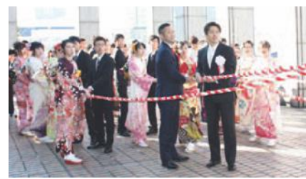
昨年度実施の様子

成人の日に新成人(平成11年4/2~12年4/1生まれで市内在住の方)の代表が、市役所屋上の「みおつくしの鐘」を打ち鳴らす行事で、63回目を迎えます。成人となった記念にぜひご参加ください。定員50人。