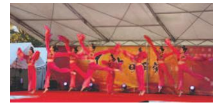
昨年の中秋明月祭大阪2018の様子