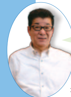
大阪市長 松井一郎

大阪市では、1人の市長が、広域行政も担いながら住民に身近な行政サービスの提供に取り組んでいます。今後、さらに複雑化・多様化が進む市民ニーズに対応していくには、今の270万人のままでは規模が大きすぎます。