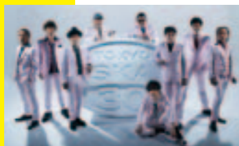
出演者:東京スカパラダイスオーケストラ