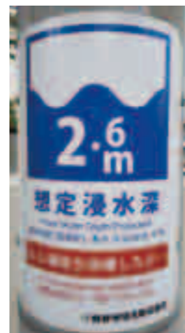
鳴野地域ですでに設置されている看板

対応 区内の広報板に、浸水深の表示とともに防災関係情報を掲載した看板を設置し、防災の情報発信を強化します。