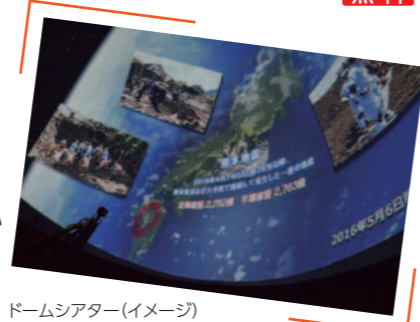
ドームシアター(イメージ)