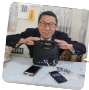
各浴場に 設置予定の 充電器です