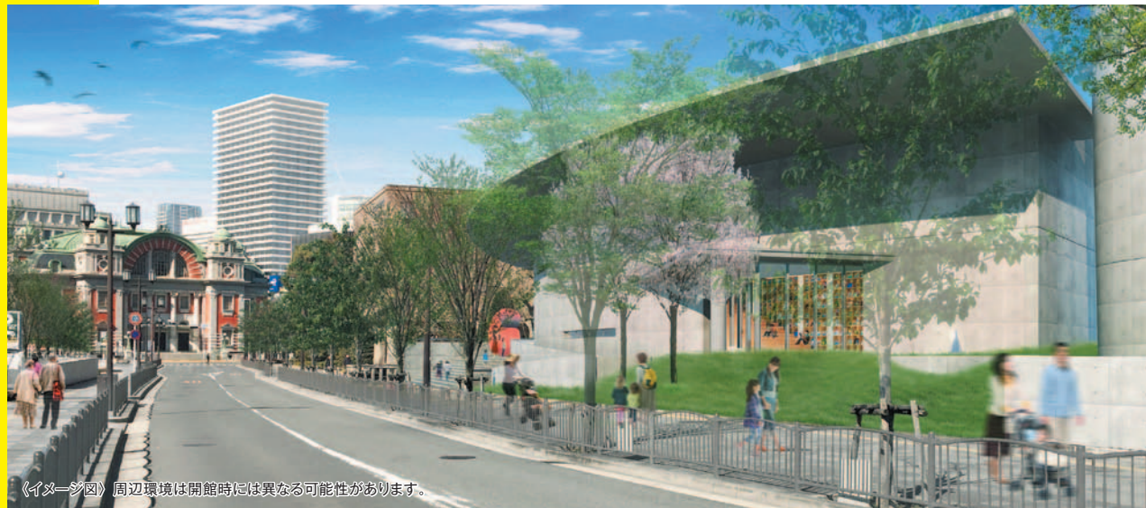
〈イメージ図〉周辺環境は開館時には異なる可能性があります。