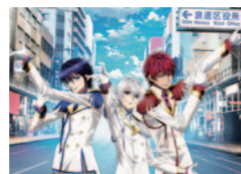
「K SEVEN STORIES」 日本橋ストリートフェスタ2020描き下ろしVer. ©GoRA・GoHands / k-7project

キャラクターやコスプレ満載のパレード、ステージイベント等を開催し、大阪が誇る趣味のまち「日本橋」の魅力をアピールします。当日は周辺道路において交通規制が行われます。ご理解・ご協力をお願いします。