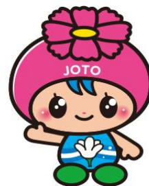
城東区マスコットキャラクター 「コスモちゃん」

お問い合わせ： 城東区保健福祉センター 保健福祉課 (保健活動) 【区役所 2階 22番窓口】