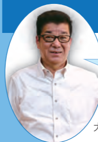
大阪市長 松井一郎

4つの特別区を設置することで、地震や豪雨など、災害発生時の情報収集や被災状況を踏まえた対応をより迅速に行いやすくなります。