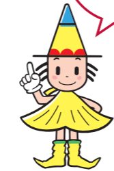
大阪市選挙マスコット「センキョン」

大阪市では、特別区の区割りや名称など、大都市制度(特別区設置)協議会でとりまとめた特別区設置協定書が、大阪市会と大阪府議会で承認されたことを受け、「大都市地域における特別区の設置に関する法律」に基づき、大阪市を廃止し特別区を設置することについての住民投票が行われることとなりました。