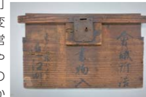
近江町会議所詰書物入（部分）明治2年（1869年）頃 個人蔵

江戸時代の町人身分の共同体であり、都市の基礎単位でもあった町。明治以降の近代化で町が受けた変化を、運営のあり方や土地所有の実態などから明らかにします。 日 1/27（水）～3/1（月）9:30～17:00（入館は16:30まで）、火曜休館（火曜が祝日の場合は翌平日） 場 問大阪歴史博物館 ☎6946-5728 FAX6946-2662