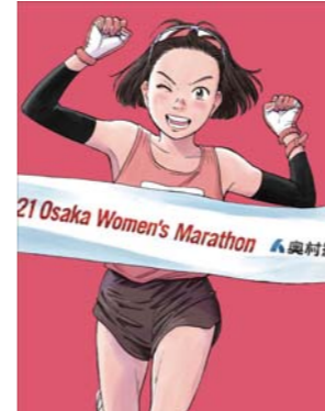
2021©浦沢直樹・N WOOD STUDIO