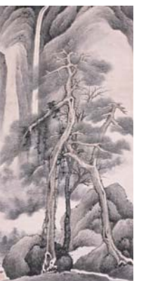
顧大申《老松飛瀑圖》（部分）清時代・康熙3年（1664）大阪市立美術館蔵（阿部コレクション）

日 1/9（土）～2/7（日）9:30～17:00（入館は16:30まで）、月曜休館（月曜が祝日の場合は翌平日） 場 問市立美術館 ☎6771-4874 FAX6771-4856