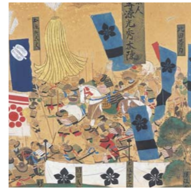
山崎合戦図屏風（明智光秀部分）

本能寺の変後、主君のかたき明智光秀を山崎合戦で破った羽柴（豊臣）秀吉ですが、彼が天下人になるためには、織田家の権威とも戦わなければなりません。織田体制から羽柴体制への移行期のドラマに注目します。 日 1/29（金）～3/17（水）9:00～17:00（入館は16:30まで）