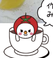
食育推進キャラクター「たべやん」