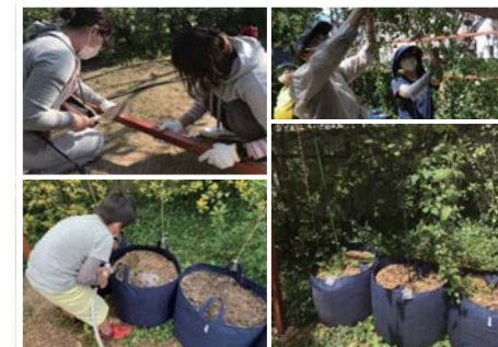
初めて取り組んだホップ栽培、柵も一から手作り丁寧に着けたホップは空高く成長しました