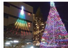
TPS内に設置している本格的なイルミネーションは、パイプを組むのも電飾を付けるのも、すべて住人の手で行われました!6メートルの光のツリーがマンション内の夜を輝かせていました

コミュニティ活性化に向けまして、引き続き、取り組まれますことを期待しております。