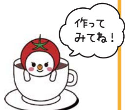
食育推進キャラクター「たべやん」

問合せ/保健福祉センター保健福祉課(保健) ☎6930-9882 ☎6930-9936