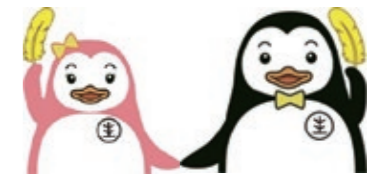
更生保護のマスコットキャラクター 更生ペンギンのサラちゃん(左)、ホゴちゃん(右)