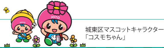
城東区マスコットキャラクター 「コスモちゃん」