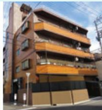
ファーストパレス (放出西3-6-1)