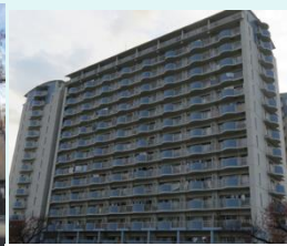
ファミールハイツ城東 (放出西1-2-51・59号)