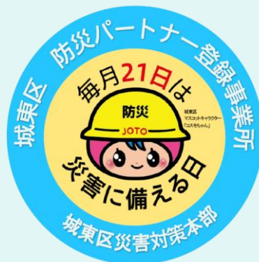
防災パートナー登録ステッカー