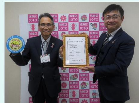
第1号の登録事業者 (大阪シティ信用金庫城東支店)