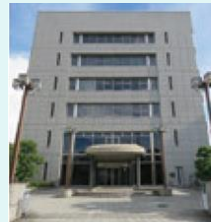
大阪府トラック総合会館 (鳴野西2-11-2)