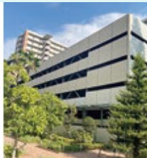
タイムズ・ピース・スクエア立体駐車場 A棟・B棟・C棟 (今福西6-2-1~3)