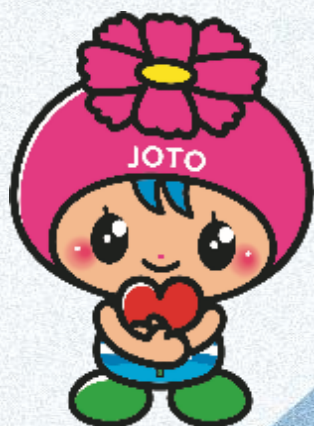
城東区マスコットキャラクター コスモちゃん