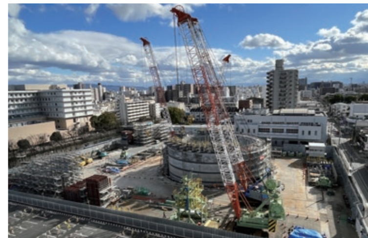
工事のようす