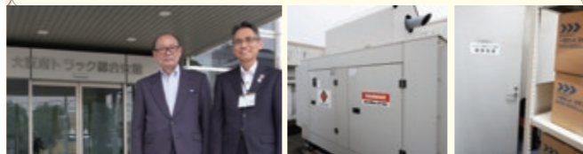
左から中川会長、大東区長 自家発電設備 備蓄物資

※大阪府トラック協会は、府下の貨物運送事業者(国土交通省の許可を受けたトラック運送事業者:緑ナンバー)で組織する一般社団法人で、昭和38年3月に設立。本部のほか12の支部で構成され、現在の会員数は約3,500社となっています。