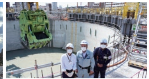
工事概要等の説明を聞きました