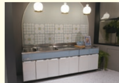
昔のホーローキッチンなども展示されています