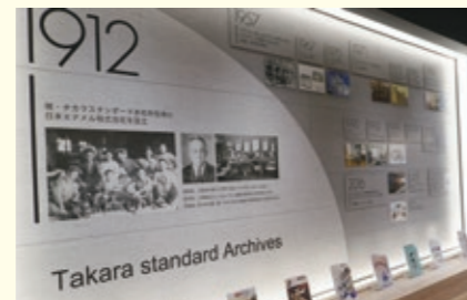
企業沿革のパネル展示