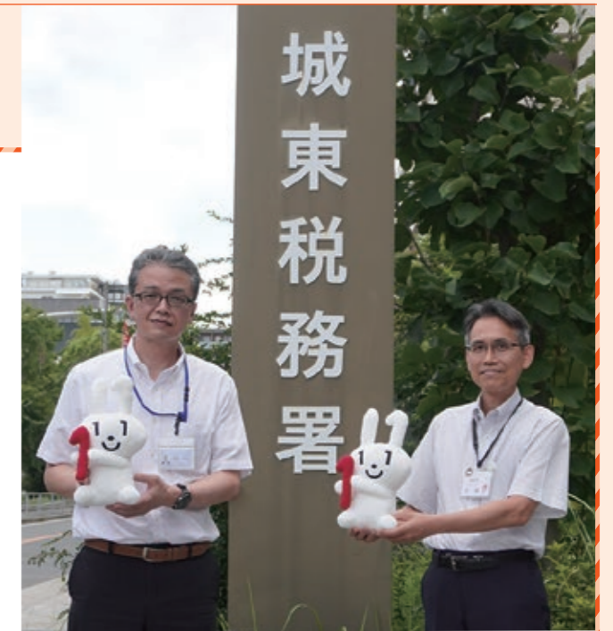
左から生田城東税務署長と大東区長

最近ではe-Tax(国税電子申告・納税システム)で税に関する申請等ができるようになっており、 スマホで申告できる時代 となっています。マイナンバーカードを利用した申告も簡単・便利で、区役所同様、城東税務署でも皆さんのマイナンバーカードの取得を強く推奨しているところです。また、国税・地方税の納付が金融機関の窓口だけでなく、パソコンやスマホを利用したダイレクト納付やクレジットカード納付ができるなど、便利さの進化が止まりません!