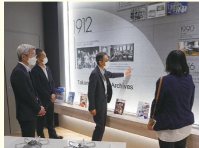
新しくできたエントランスの説明をお聞きしました