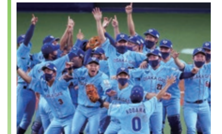
前回優勝チーム:大阪ガス

全32チームが出場し、社会人野球日本一を決定する最高峰の大会のチケットを500組1,000人にプレゼント。対象は市内在住・在勤・在学の方。詳しくはHPをご覧ください。 日 10/30(日)～11/9(水)の間で開催(予定) 場 京セラドーム大阪 申 10/17までにHPで。 問 経済戦略局スポーツ課 ☎ 6469-3882 FAX 6469-3898