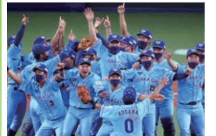
前回優勝チーム:大阪ガス

全32チームが出場し、社会人野球日本一を決定する最高峰の大会のチケットを500組1,000人にプレゼント。対象は市内在住・在勤・在学の方。詳しくはHPをご覧ください。 日 10/30(日)～11/9(水)の間で開催(予定) 場 京セラドーム大阪 申 10/17までにHPで。 問 経済戦略局スポーツ課 ☎ 6469-3882 FAX 6469-3898