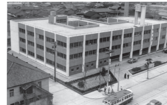
昭和34年完成の城東区役所旧庁舎と蒲生四丁目交差点